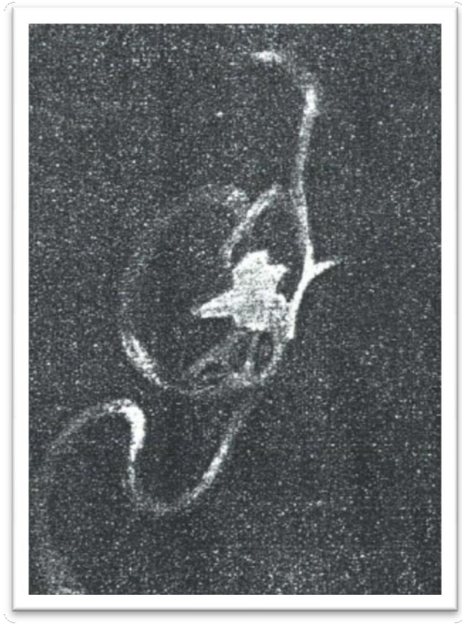
Fotografia de um ectoplasma em formação. Estava suspenso, mas estacionário quando foi fotografado pelo Sr. Melton

Duas provas fotográficas dessa substancia, e que foram apanhadas dentro do porta voz, quando os espíritos falavam, estão publicadas na "Light" de 20 de Agosto de 1921 e neste livro.